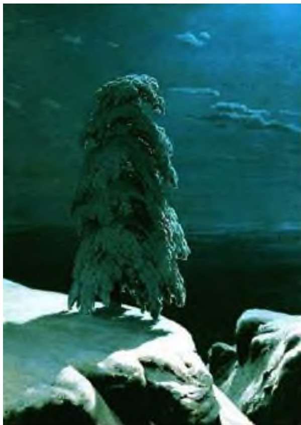
Иван Шишкин. На Севере диком..., 1891.

Творческая составляющая задания может быть усложнена предложением составить словесное описание замысла пейзажа – как заказа художнику, указав желаемую композицию, ракурс, характерные черты изображаемого и способы их достижения.