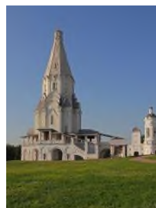
3. Церковь Вознесения Господня в Коломенском (Москва)