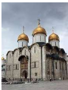
1. Успенский собор в Московском Кремле