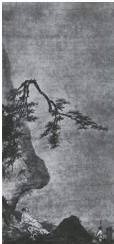
Ма Юань. Лунный свет. Живопись тушью на шелке. XII-XIII вв.

2. Какими эмоциональными доминантами, по Вашему мнению, хотел наделять художник каждое произведение?